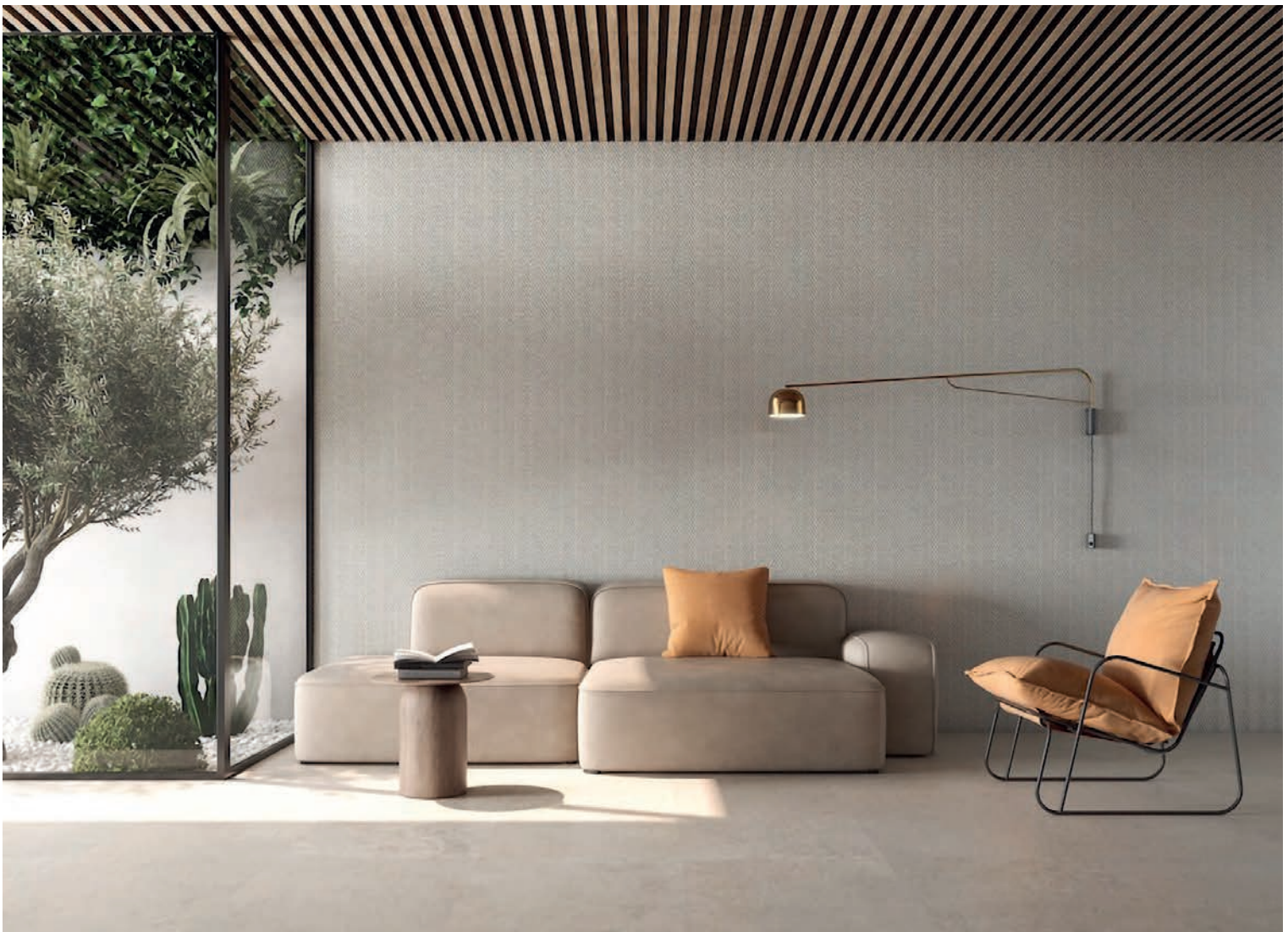
Roca Tiles exhibirá en el evento internacional su nuevo concepto empresarial "The New Standard"

Entre ellos, uno de los productores cerámicos más reconocidos es Roca Tiles , propiedad del Grupo Lamosa. La compañía reflejará en su stand ferial la estrategia integral de la compañía a largo plazo en torno al concepto The New Standard , fruto de un profundo análisis corporativo en el que se han identificado los atributos de la firma y sus superficies. Este nuevo estándar pone el foco en