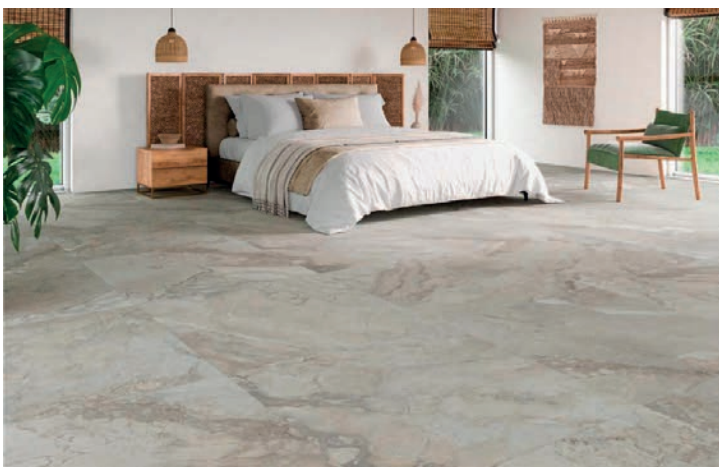
Gravity , de Alaplana Cerámica, apuesta por los acabados naturales con piezas que aportan distinción y atemporalidad

Alaplana Cerámica piensa en Cevisama 2023 a lo grande y lo hace con una estudiada mezcla de materiales naturales que tiene en la colección Gravity su principal exponente. Se trata de una propuesta pensada para espacios únicos que se niegan a pasar desapercibidos. La variación gráfica de las diferentes piezas y el acabado mate enriquecen todavía más esta excepcional colección cerámica. Gravity está disponible en dos formatos rectificados, 60x120 y 100x100 cm, y se puede encontrar en dos colores: noce y white .