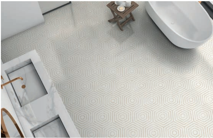
Venezia , un mármol hexagonal porcelánico de Keros que se enriquece con decorados geométricos

Otros diseños de nuevo cuño de la firma castellanense son Venezia (23x27 cm), una superficie de mármol hexagonal porcelánico, en acabado mate, con un ligero destonificado, combinado con unos decorados geométricos. Y también los mármoles porcelánicos en gran formato Ardenza y Vernazza .