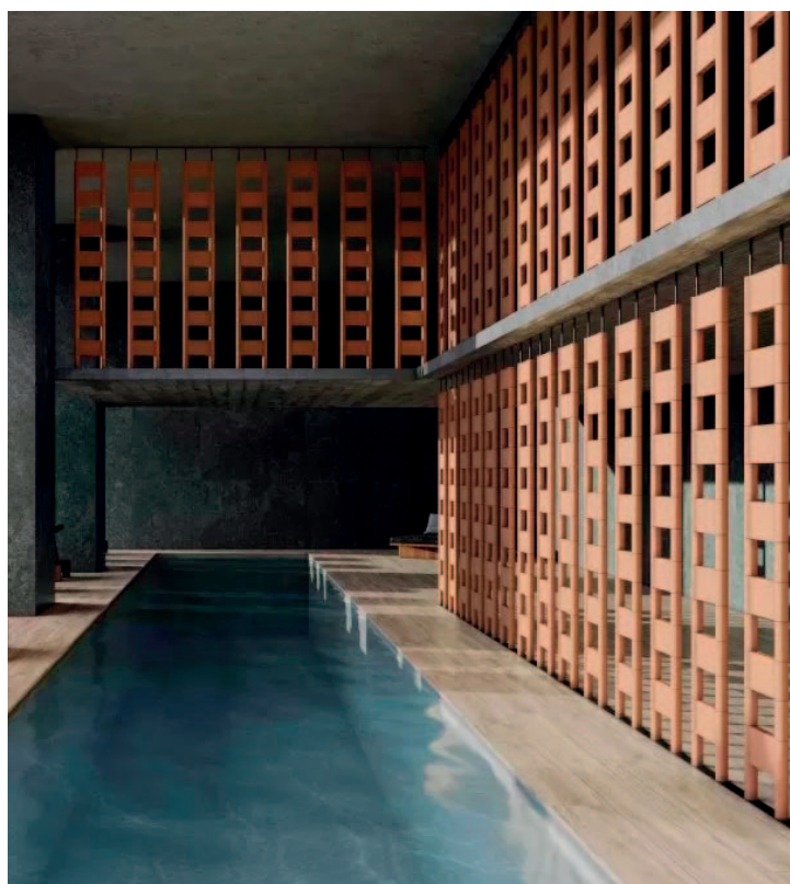
Curtain , la novedosa celosía cerámica de Exagres

Finalmente, Curtain es la sorprendente celosía cerámica de Exagres , capaz de articular el espacio y esculpir la luz. Una solución arquitectónica proyectada para el interiorismo y las zonas de transición a espacios de exterior.