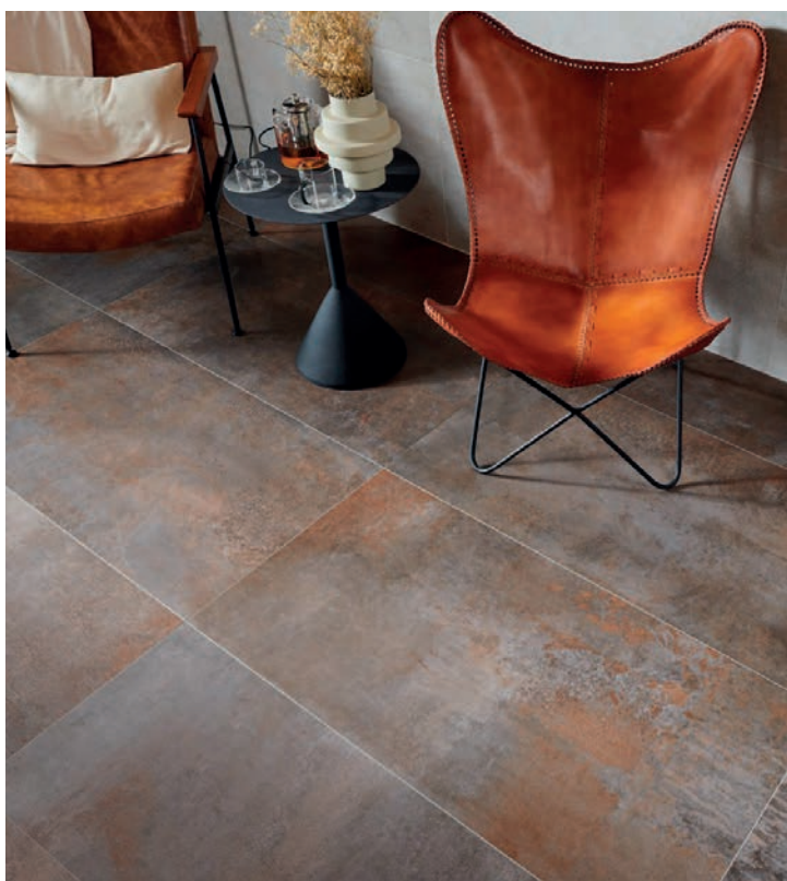
Universe , de Keraben , un diseño capaz de seducir incluso a los espacios más exigentes por su capacidad de transformar el concepto del metal

Las tres marcas de la compañía estarán representadas por tres viviendas diferentes, atendiendo al valor de la elegancia de Keraben , el estilo de Metropol y la creatividad de Ibero . Y entre sus colecciones merece la pena conocer Universe , de Keraben , diseñada para seducir incluso a los espacios más exigentes por su capacidad de transformar el concepto del metal en una opción estilística. Lo que más llamará la atención de ella es su cromatismo envejecido de sus tonos y texturas que simulan el inexorable paso del tiempo.