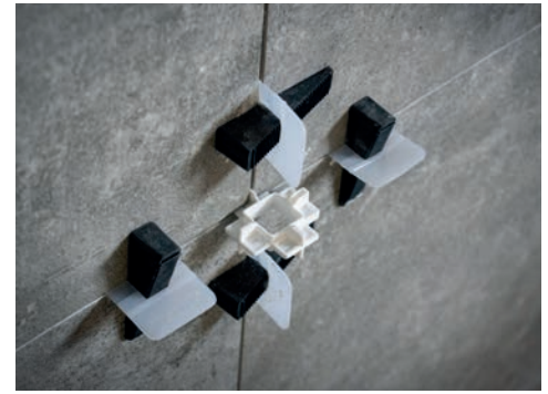
Sistema de nivelacion y Multi X