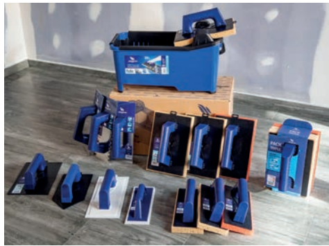
Cubo de rejuntado, talochas y llanas