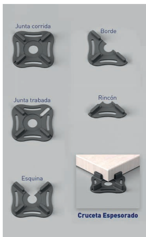
Crucetas de esponsorado

WITH ALL THEIR EFFORTS FOCUSED ON INNOVATION, PEYGRAN SURPRISES AGAIN IN THIS EDITION OF THE FAIR.