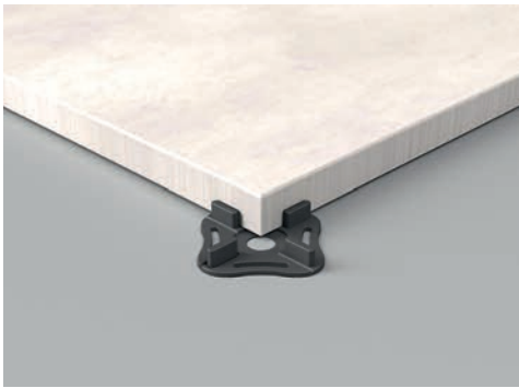
Cruceta de espesorado