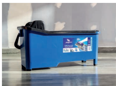
Cubo de rejuntado