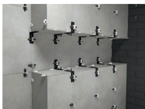
Escuadra de nivelacion