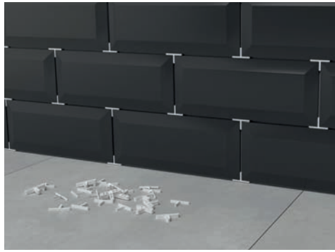
Crucetas en T