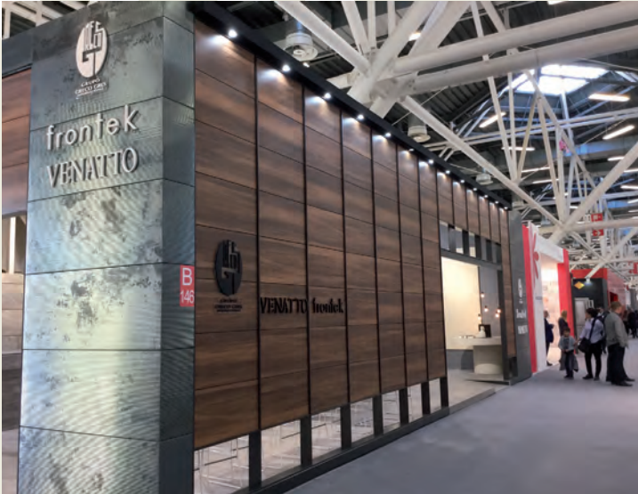
Grupo Greco Gres.